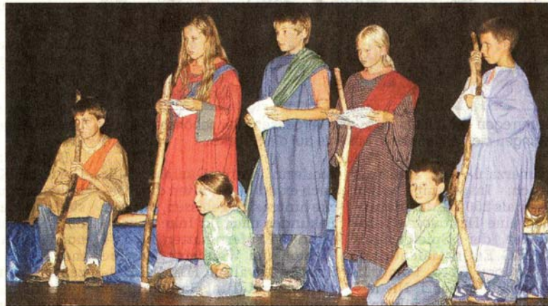
Die fünf „Jünger“ führten in den Eutiner Schlossterrassen durch das Stück „Der Verrat“. Alle anderen Kinder sangen in verschiedenen Chören.

wurden die Requisiten gebaut und viele Ausflüge in die Umgebung unternommen. Dass die Aufführung nun in den Schlossterrassen stattfand, sei dem Stadtjubiläum zu verdanken. „Schließlich haben die Kinderfreizeiten 1998 in der Neuapostolischen Kirchengemeinde Eutin angefangen, zum 750. Geburtstag wollten wir daher gerne hierher“, so Mehlhose. Eigentlich sei die Kinder-