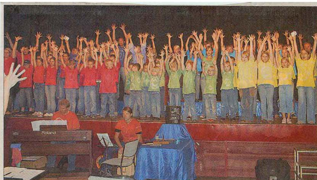
Das Spiel der Freizeit-Kinder kam an. In den Eutiner Schlossterrassen gab die Truppe das Musical „Der Verrat“.

Tageszeitung „Ostholsteiner Anzeiger“ - Samstag, 18. August 2007: